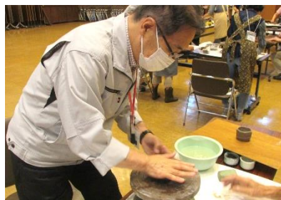
【ひまわり楽級 陶芸教室模様】