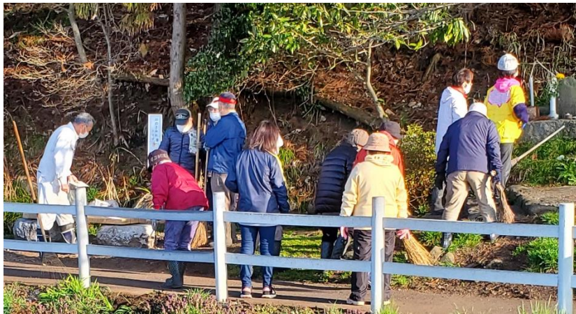
5区の皆さんの清掃風景・ありがとうございました