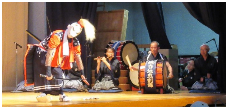
滑田系に伝わる「狐剣舞」を披露（谷地鬼剣舞）

滑田系鬼剣舞全演目記念公演が7月8日、江釣子地区交流センターえぶりんホールで開催され、滑田鬼剣舞（11区）と谷地鬼剣舞（4区）が出演。「風流踊」ユネスコ無形文化遺産登録を祝い、記念公演し伝承を誓いました。