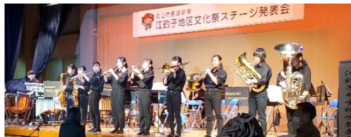
去年のステージ発表の1コマ