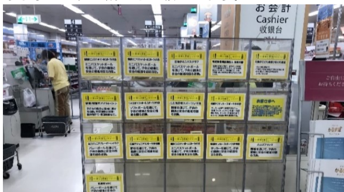
1階食品売場のレジの出口に設置された団体のボックス

「江釣子ショッピングセンターパル」内にあるイオン江釣子店では、幸せの黄色いレシートの日を毎月11日に実施しています。レシートを団体のボックスに入れていただくと合計金額の1%にあたる品物が団体に寄付されます。江釣子地区の団体のボックスもありますので、ご協力をお願いします。