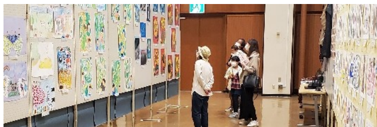
去年の文化祭作品の展示の様子