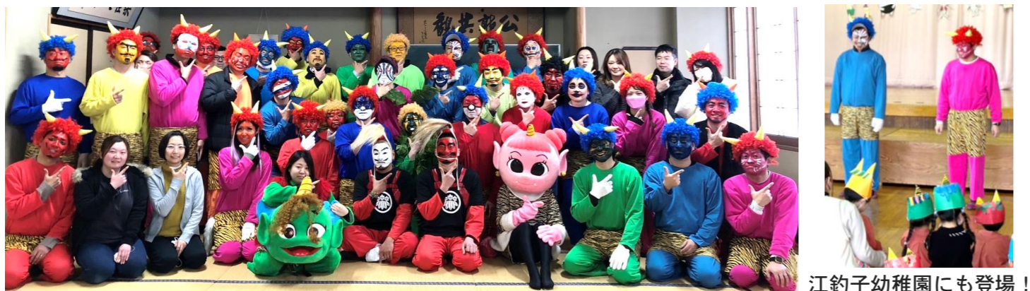
江釣子幼稚園にも登場！