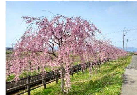
春は43本のシダレザクラが公園を彩ります