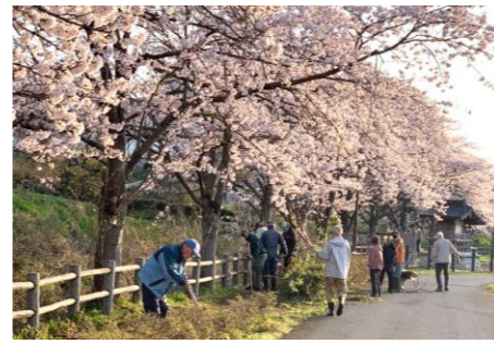
去年の清掃活動の様子