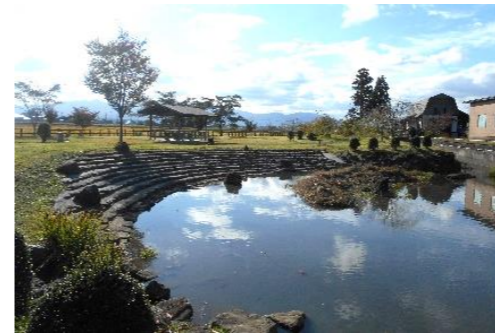
鳩岡崎親水公園には親水段々が設けられています

おすすめポイントは、公園のメインにと水路沿いに植栽した43本の美しいシダレザクラとのこと。今年の春はぜひ、新たに北上市の景観資産の仲間入りをした鳩岡崎親水公園でお花見をお楽しみください。