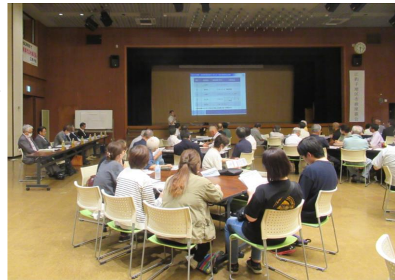
座談会では地区民から貴重な声が寄せられました

このほか、民間こども園新設に関しては「設置場所の園庭が狭いし、園舎にホールがない。再検討を」「園舎前の道路が狭く、事故発生が心配。説明会を再度開き、保護者の声を聴いて」などの声があり、市は「いろいろな意見・疑問がある中、計画に沿って事業を進めることはできない。意見を聴く機会を設けていく」と答えました。その後、市長ほか、幹部職員を交え、懇親会を行いました。