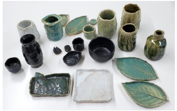
受講生の皆さんの作品

受講生の皆さんは、自分の作品の出来栄えに感動し、また作品制作したいと話していました。