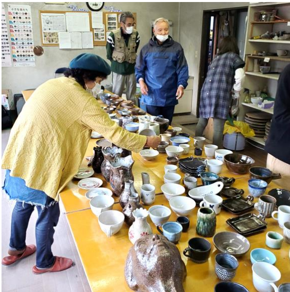
窯出し模様—力作が一杯