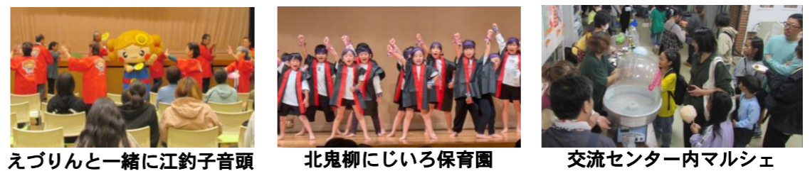
えぶりんと一緒に江釣子音頭 北鬼柳にじいろ保育園 交流センター内マルシェ

9月22日秋分の日に開催した第48回えぶりこ古墳まつりは願いもむなく雨模様で始まり、天気予報を信頼して開催前々日には交流センターでの屋内開催を決定し、覚悟はしていたものの、広々とした古墳公園で実施したかったのが本音でした。先人への供養式典は厳かに行われたほか、芸能公演にはホールが溢れんばかりの観客が詰めかけ、マルシェも大盛況となりました。当日の入込数は約1500人。終わったころには雨も上がり、まつりを成功裏に終えることができました。