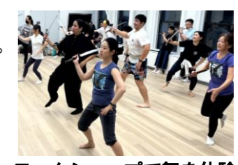
ワークショップで舞を体験